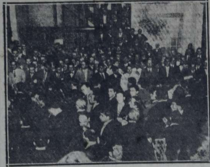
EN EL HALL DE LA CASA DEL PUEBLO, ESPERANDO TURNO PARA VISITAR LOS RESTOS.

Centro Socialista de la sección 14a. - La C. A., interpretando el sentir de los afiliados al Centro, resuelve: Expresar a la madre, esposa e hijos del maestro del socialismo en la República Argentina su profundo pesar por la muerte prematura del doctor Juan B. Justo.