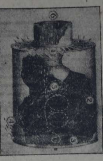
Fig. 2. — Depurador de aire empleado delante del carburador para filtrar las impurezas que pueden provocar un desgaste prematuro del motor.

El principio de un depurador de aire eficaz, puede ser igualmente muy simple. Está basado sobre la acción de la fuerza centrífuga sobre los cuerpos de densidad diferente, a saber: el aire y el polvo que el contiene. El aspirador tiene la forma de un cilindro adaptado a la tubería de llegada del aire al carburador, cuyo cilindro en un extremo está provisto de aletas fijadas e inclinadas. El aire aspirado por el motor atraviesa las aletas y adquiere un movimiento de torbellino (1, fig. 2). La fuerza centrífuga rechaza entonces el polvo más pesado que el aire contra las paredes laterales del cilindro, y el torbellino helicoidal carga el polvo contra el fondo del depurador (2 y 3, figura 2). El polvo en torbellino es entonces proyectado contra la hendidura construída a tal efecto en la pared del cilindro (4, fig. 2). El aire así purificado y aspirado por el motor vuelve a ocupar la parte central del aparato donde un deflector en dirección el torbellino y se encamina entonces normalmente hacia el carburador (5 y 6, fig. 2).