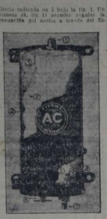
Fig. 1. — Un depurador de aceite muy simple que permite aumentar la duración de utilización del aceite de un motor y disminuir el uso de las piezas en movimiento.

tro a fin de evitar que se enturbie el funcionamiento de la circulación del aceite.