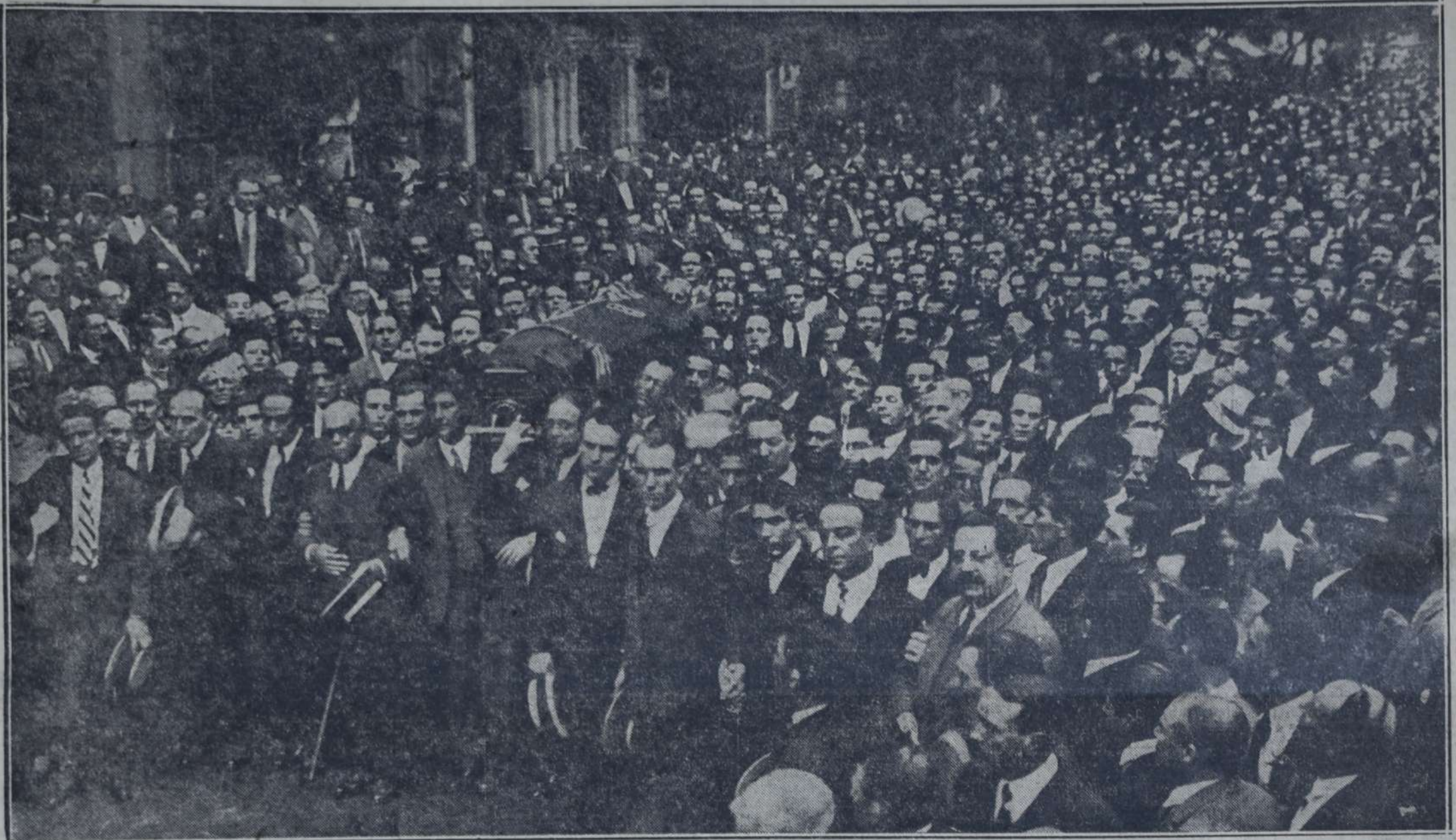
LA INMENSA COLUMNA SE PONE EN MARCHA — AUTORIDADES DEL PARTIDO Y MIEMBROS DEL GRUPO PARLAMENTARIO LA ENCAEZAN, LLEVANDO EN HOMBROS EL FERETRO.

El sepelio del inolvidable y fuerte luchador socialista ha resultado una grandiosa apoteosis de su vida y de su obra