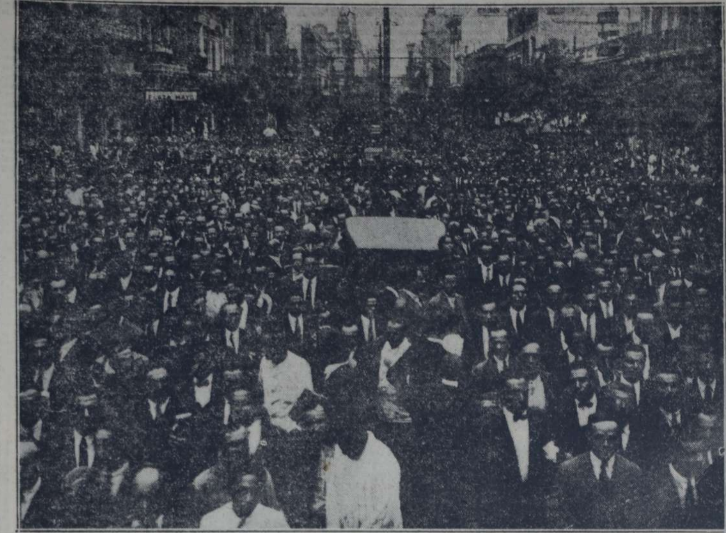
IMPONENTE PERSPECTIVA DE LA CALLE RIVADAVIA, AL INICIARSE LA MANIFESTACION POPULAR DE DUELO.

Yo quiero tan solo que en este instante de supremo recogimiento mi conciencia y la de los compañeros en cuyo