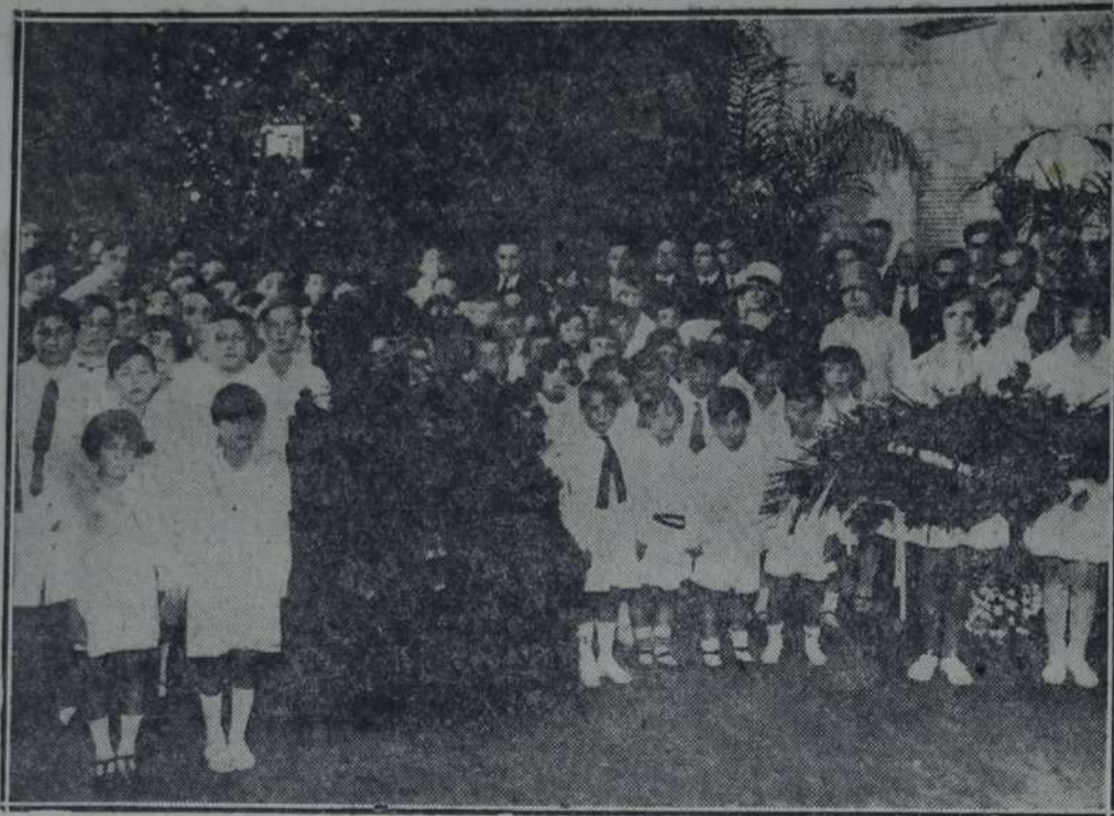
LOS NIÑOS DE LOS RECREOS INFANTILES RODEANDO EL FÉRETRO

Los niños sabían que así saludaban al que dió toda su vida para labrar para ellos un presente y un porvenir mejores!