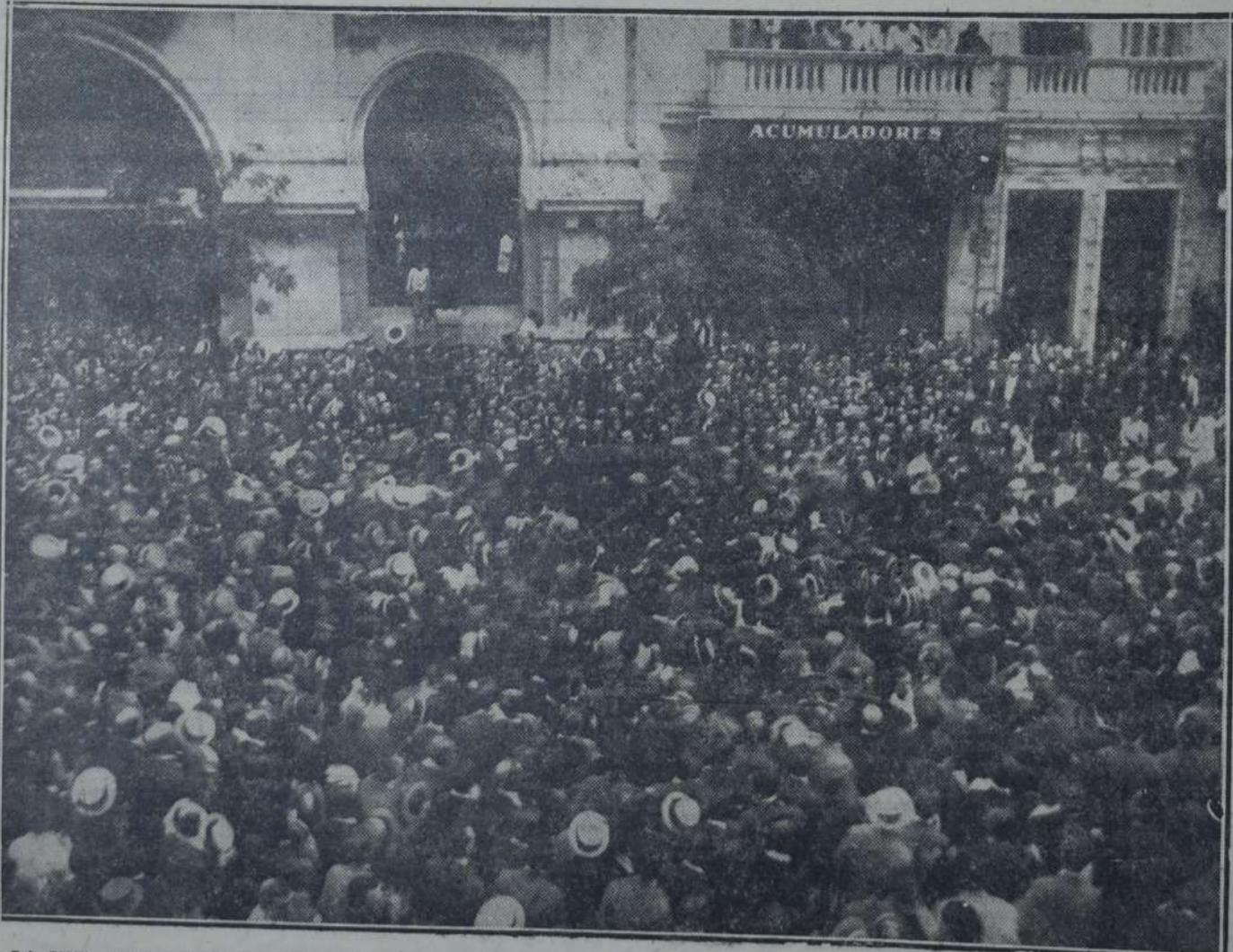
LA MULTITUD REUNIDA FRENTE A LA CASA DEL PUEBLO, EN EL MOMENTO DE SER DESCENDIDO EL FÉRETRO.

Me declaro incapaz de trazar, en estas circunstancias, aunque sea breve y sumariamente, la silueta eminente, austera, vasta, múltiple y completa del más grande socialista argentino e internacional de los últimos tiempos. Y si lo intentara — vano intento — mis sentimientos y mis palabras me traicionarían. Apenas haré un bosquejo fragmentario e incompleto de su obra parlamentaria, la más vasta y fecunda que realizara legislador alguno en el último cuarto de siglo en el congreso argentino.