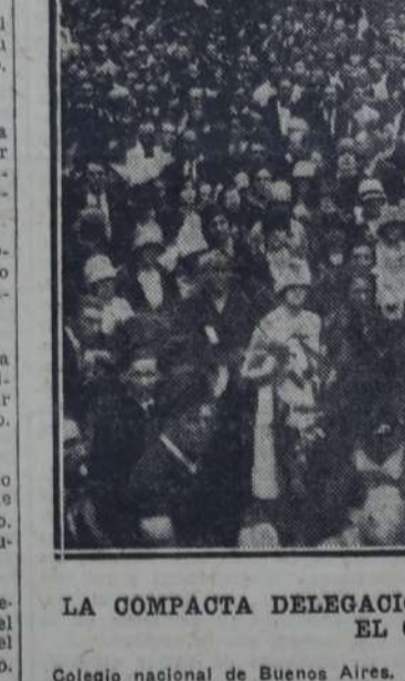
LA COMPACTA DELEGACION FEMENINA, ENCABEZANDO EL CORTEJO

Asociación Obrera de Socorros Mutuos - La junta administrativa de la Asociación Obrera de Socorros Mutuos, reunida extraordinariamente en el día de la fecha, con motivo del fallecimiento del doctor Juan B. Justo para rendirle un homenaje póstumo al hombre que promovió la fundación de esta Mutualidad, sugiriendo a un núcleo de trabajadores la fundación de un Socorro mutuo auténtico, resuelve: